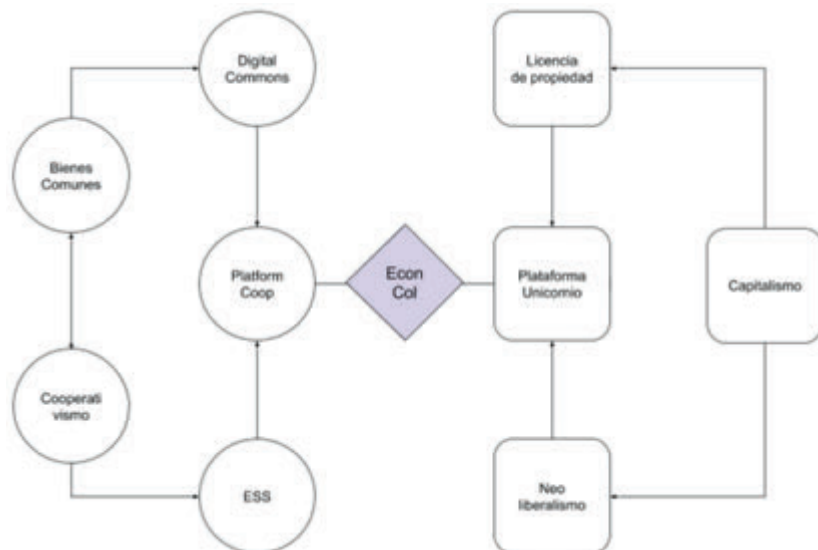
FIGURA 1. MARCO CONCEPTUAL PARA UNA REVISIÓN CRÍTICA DE LAS PLATAFORMAS TECNOLÓGICAS DE ECONOMÍA COLABORATIVA.